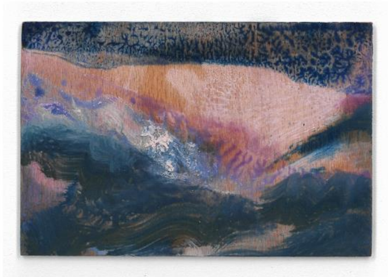
Sammi Mak Eros, The Bittersweet 2022 10 x 16 cm / 11 x 15 cm Oil on plywood, set of 20