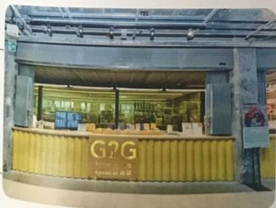
YanYan 的掛毯作品《人人掛起荷李活道》部分物料來自「G2G 舊衣新裝循環系統」從社區回收的舊衣紡織物料再造而成。