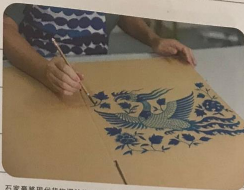
石家豪將現代貨物運輸常用的紙箱轉化為繪製着古典的花紋和圖案的《紙箱傳》。